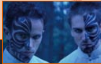
... certains ayant d'étranges pouvoirs .